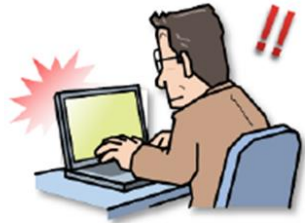
実際のサポート詐欺の画面と音声